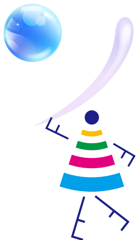
ロゴデザイン 上田篤嗣 (カダ アツシ)