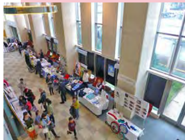
昨年のファッションショー・会場の様子

※リハ並木祭は、国立障害者リハビリテーションセンターと国立職業リハビリテーションセンターの合同文化祭です。 利用者・職員・学院生が協力し、日々の訓練やクラブ活動の成果等を発表し、地域の方々との交流を深めること等を目的としています。